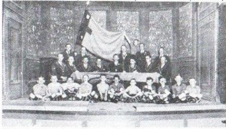
De R. K. Sportsvereniging PVC in 1935. Het elftal met trainer en enkele bestuurlijke leden. Men zit hier in het gebouw van de stad van het school van X en W. waar een sportveld is aangelegd.